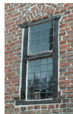
Het oorspronkelijke raam in de zijgevel van het Hooghuis, langs de Beemdenstraat.

De smidse en de herberg in het Hooghuis waren in de eerste helft van de 20ste eeuw de trekpleister van het volkse leven in de wijk, onder meer als lokaal (1907-1955) van de schuttersgilde Sinte-Barbara.