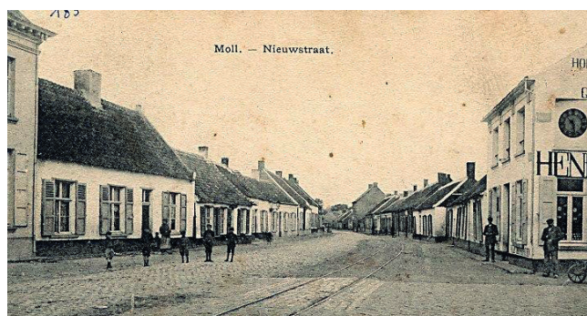
Een oude prentkaart met de laatste woningen van de Markt die al een verdieping hebben en de eerste lage en witgekalkte huisjes van de Nieuwstraat, het begin van de arbeiderswijk Ginderbroek.

De indeling gebeurde op basis van arbeid. Ginderbroek was een arbeidersbuurt of een wijk van dagloners, in Mol-Centrum woonde de burgerij en Ezaart leefde van de landbouw. Dat zag je best aan de woningbouw. In Ginderbroek waren het eenvoudige werkmansoptrekjes, zelfs zonder dakgoot, in Mol-Centrum hadden de huizen al een verdieping en in Ezaart had je heel wat keuterboerderijtjes.