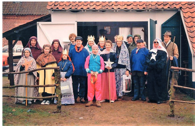
Vrijwilligers van het Kerstcomité zingen Driekoningen ten voordele van het Kersthuis.