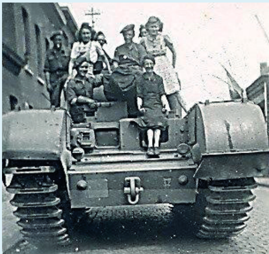
September 1944 – Jonge vrouwen uit de Nieuwstraat vierden de bevrijding op een Sherman van de eerste kolonne tanks die over de kasseien van Ginderbroek binnen denderd.

In de geschiedenisboeken over de Tweede Wereldoorlog komen doorgaans alleen maar de grote wapenfeiten voor.