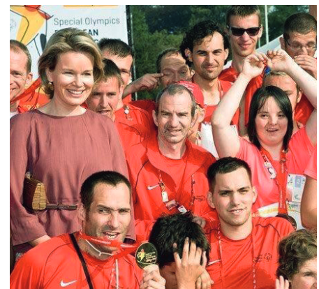
Koningin Mathilde te midden van de atleten

Maar er was eens een koningin... Mathilde heette ze. De vorstin reed op 4 september 2014 in haar koninklijke wagen met nummerplaat 2 door de Rode Kruislaan om aan het sportcomplex Den Uyt in onze wijk uit te stappen. Ze wilde aanwezig zijn op de atletiek- en gymnastiekwedstrijden van de Special Olympics die hier plaats hadden. Wat was het koninklijk bezoek een opsteker voor alle atleten en vrijwilligers!