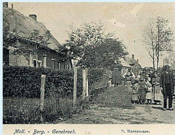
Een foto van 1903. Deze woningen op het einde van Den Berg (nu Hoogstraat) zijn op het nippertje ontsnapt aan het gloeiende vuur van 1899.

Tijdens deze brand van 13 mei 1899 werden 15 woningen in Hoogstraat en 2 in Ginderbroek helemaal vernield.