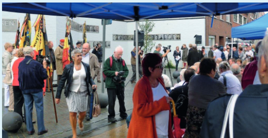
De inhuldiging van het Martelarenpleintje in 2011 op de hoek van de Martelarenstraat en de Nieuwstraat met een gedenkplaat ter ere van de politieke gevangenen en een wand met de foto's van alle gedeporteerde Mollenaars, waarvan een tiental uit onze wijk.

Na de bevrijding besliste de gemeente op 1 januari 1948 ter nagedachtenis van en als huldeblijk voor de vele Molse gedeporteerden die niet meer zijn teruggekeerd, om de straatnaam Veldstraat te veranderen in Martelarenstraat.